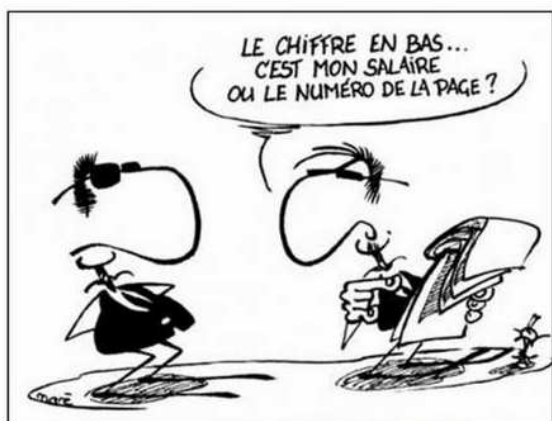
Le Man In Black